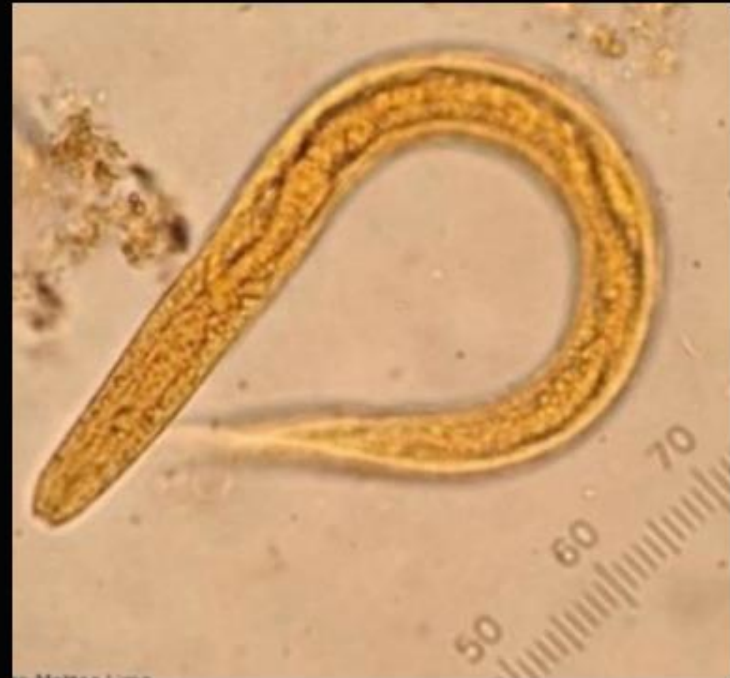
Larva de Strongyloides stercoralis

Nematóide (helminto) comum em regiões tropicais e subtropicais.