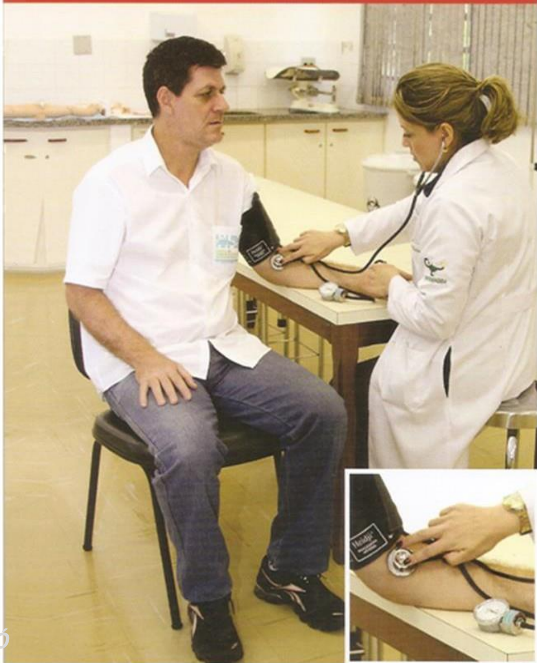
Machado, JP; Veiga, EV